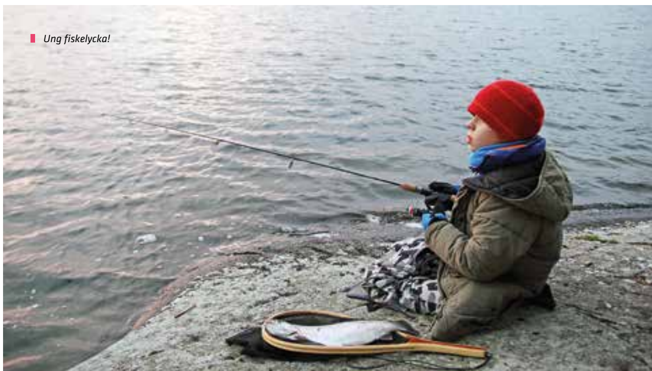
■ Ung fiskelycka!

Region Mälardalen har tre vatten där det planeras ut främst regnbåge och ibland även röding till vinterfisket. Sjön Trekanten ingår i Sportfiskekortet. Mellansjön och Kvarnsjön på Värmdö säljs det separata fiskekort till. Där sätts det också ut mer fisk och båtar går att hyra. Beläggningen har varit något lägre under 2015, vilket beror på att vi hade en kortare isperiod än vanligt.