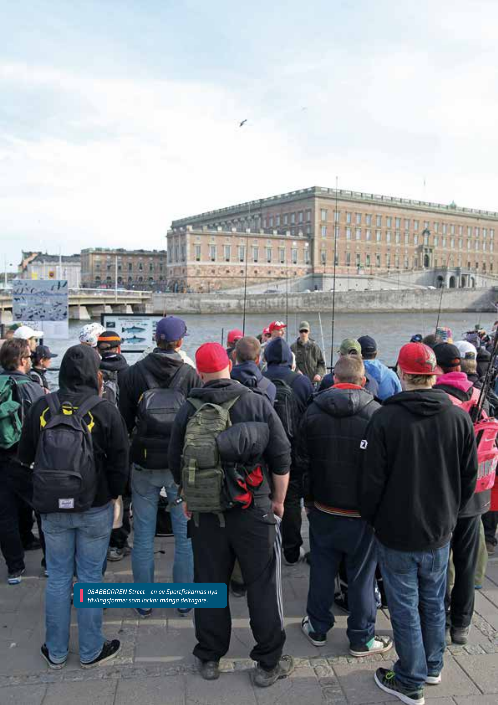
08ABBORREN Street - en av Sportfiskarnas nya tävlingsformer som lockar många deltagare.