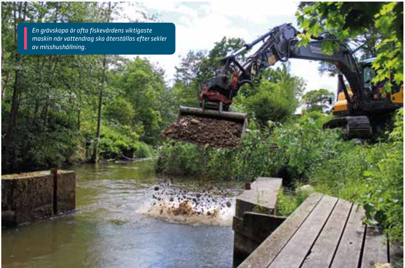
En grävskopa är ofta fiskevårdens viktigaste maskin när vattendrag ska återställas efter sekler av misshushållning.