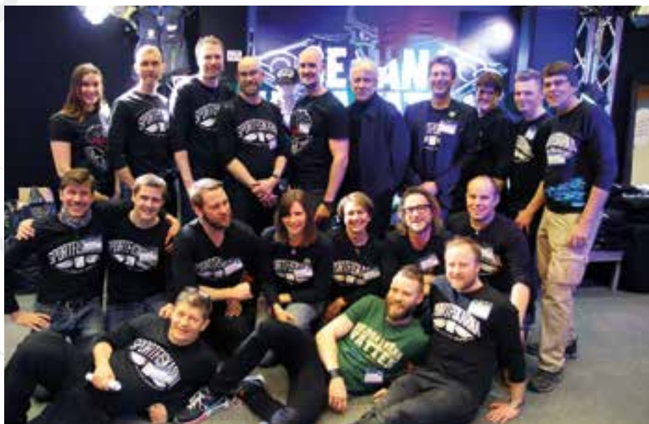
Delar av Sportfiskarnas laguppställning på Sportfiskemässan 2015 i Jönköping.