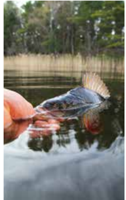
Maximått på abborre har införts på sjön Yngern för att stärka abborrbeståndet.

Flera provfiske har genomförts med ryssja, nät eller el. Uppdragsgivare har varit länsstyrelserna i Stockholm och Södermanland samt flera kommuner i Stockholms län.