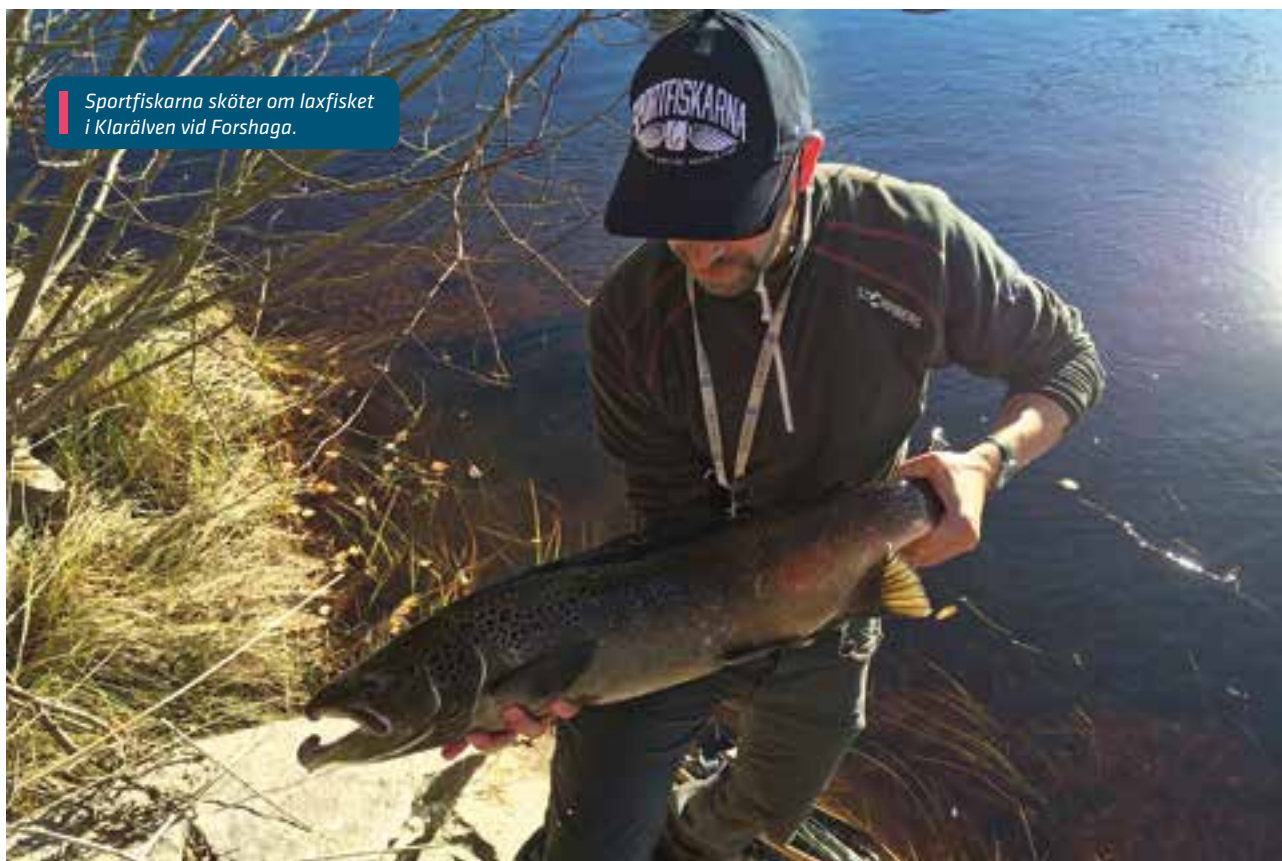
Sportfiskarna sköter om laxfisket i Klarälven vid Forshaga.