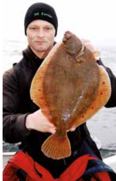
En fin rödspätta fångad i Öresund.